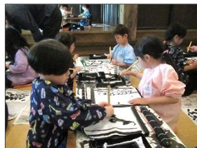
<5歳児>願いは、文化の伝承。結果的に、文字に関心をもつことに…