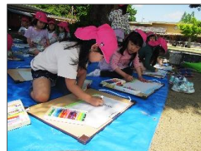
<5歳児>こいのぼりを見ながら絵を描きました