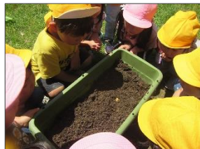
<4歳児>栄養のある土(腐葉土)を運び、さやいんげんの種をまきました