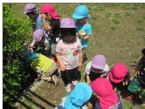
<3歳児>「ダンゴムシがいた」「アリもいたよ」虫探しに夢中です